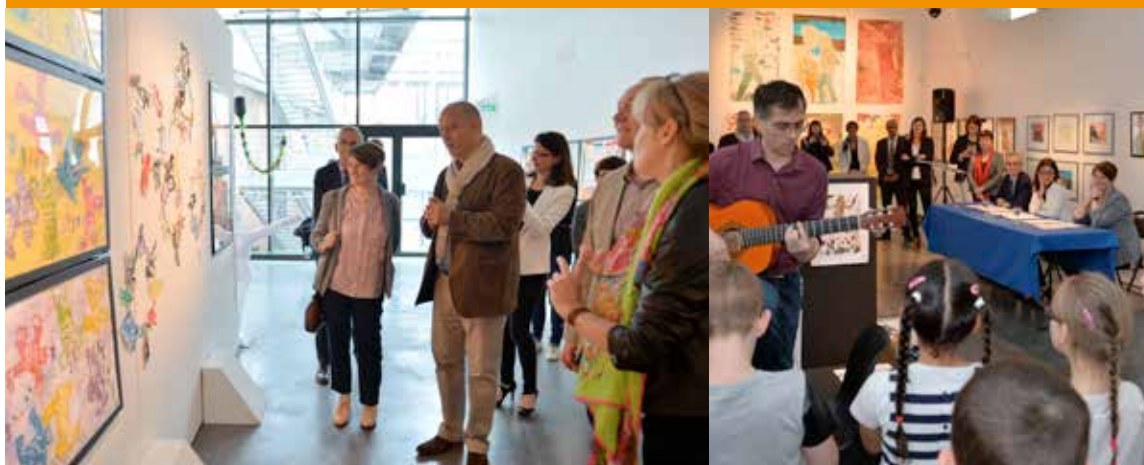
Daniel Rapaich / DICOM-Ville de Lille

Lille 2004 Capitale Européenne de la Culture se poursuit avec les manifestations de lille3000 qui propose d'explorer les richesses et les enjeux du monde de demain en invitant le plus grand nombre à la découverte des cultures et des artistes les plus contemporains. Les manifestations de lille 3000 se déploient sur l'ensemble du territoire. Avec de grandes expositions d'art contemporain, des installations artistiques dans la ville, des rendez-vous artistiques, lille3000 s'adresse à tous, et surtout à un public familial. Dans le cadre de la politique familiale de lille3000, tout enfant qui visite une exposition avec sa classe bénéficie d'une entrée gratuite pour pouvoir y retourner avec ses parents. L'aspect ludique et la médiation culturelle, au cœur de toutes leurs propositions, attirent un grand nombre de scolaires. Les thématiques proposées lors des diverses éditions sont alors exploitées avec enthousiasme par les enfants et leurs enseignants. L'exposition « Môm'art » en donne à chaque fois un bel aperçu.