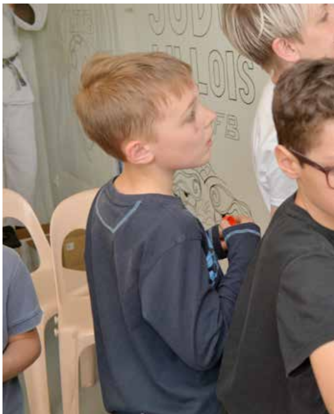
Daniel Rapaich / DICOM-Ville de Lille

C'est avec l'envie d'inscrire la coéducation au cœur du projet qu'une large concertation a été menée de novembre 2015 à septembre 2016 avec l'Éducation nationale, le réseau associatif, les services de la Ville et les représentants des parents d'élèves. L'occasion de réaffirmer les valeurs fondatrices du PEG lillois mais aussi de s'accorder sur les ambitions et enjeux actuels afin que tous participent, partagent et s'engagent dans le projet. Les orientations et propositions déclinées ici, selon les enjeux éducatifs précédemment énoncés, sont donc le fruit d'une réflexion de l'ensemble des acteurs de la communauté éducative lilloise.