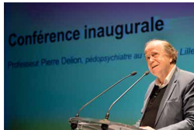
Daniel Rapaich / DICOM-Ville de Lille