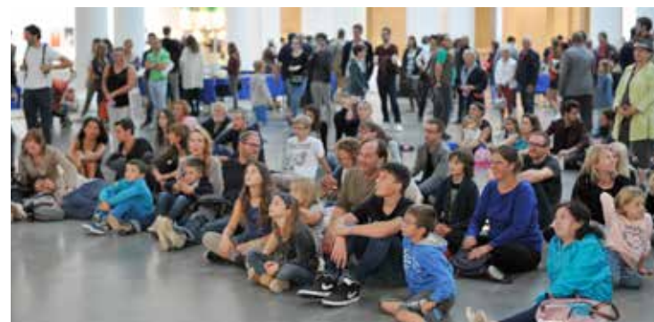
Julien Sylvestre / DICOM-Ville de Lille