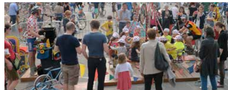
Daniel Rapaich / DICOM-Ville de Lille