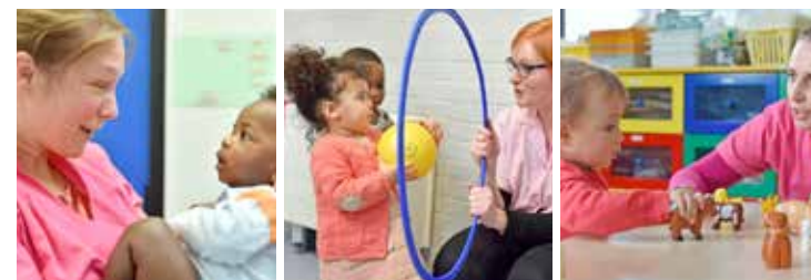
Anaïs Gadeau / DICOM-Ville de Lille